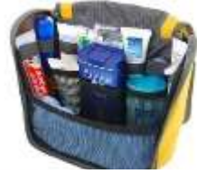
洗漱包 xǐshùbāo косметичка