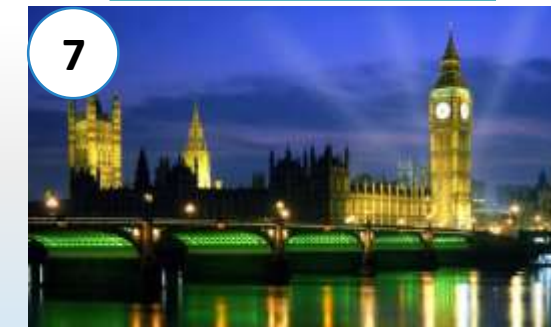
大本钟 (dàběnzhōng) Биг Бен