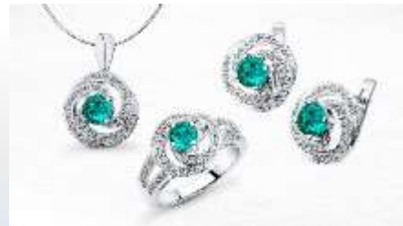
首饰 shǒushì украшения