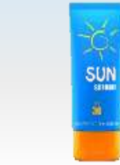
助晒剂 zhùshàijì крем для загара