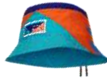
渔夫帽 yúfūmào панама