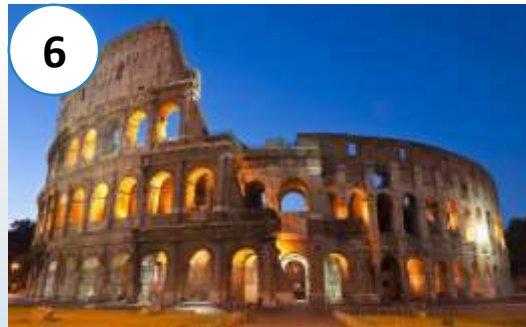
罗马斗兽场 (luómǎ dòushòuchǎng) Колизей