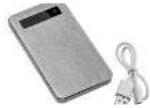
充电宝 chōngdiànbǎo пауэрбанк