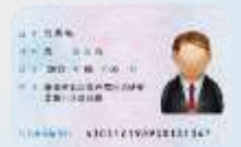
身份证 shēnfènzhèng удостоверение личности