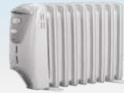
加热器 jiārèqì обогреватель