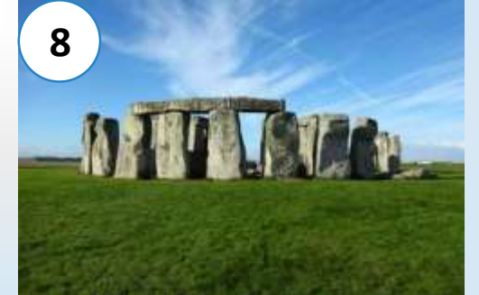
巨石阵 (jùshí zhèn) Стоунхендж