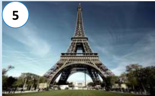
埃菲尔铁塔 (āifēi'ěr tiětǎ) Эйфелева башня