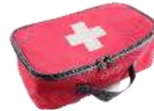
药箱 yàoxiāng аптечка