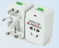
转换插头 zhuǎnhuàn chātóu переходник для розетки