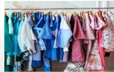
衣服很少 málo ódezhdy